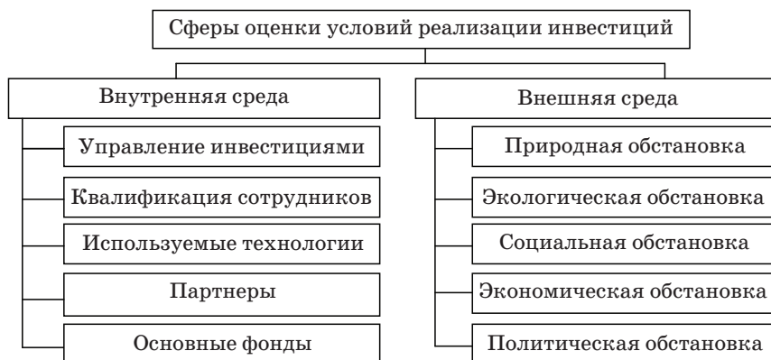
Рис. 2. Сферы оценки условий реализации инвестиций

Сферы оценки условий реализации инвестиций представлены на рис. 2.